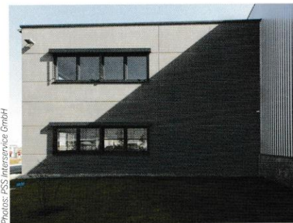
Nachher: Ein homogenes Oberflächenbild mit charakteristischer Betonoptik und -haptik.